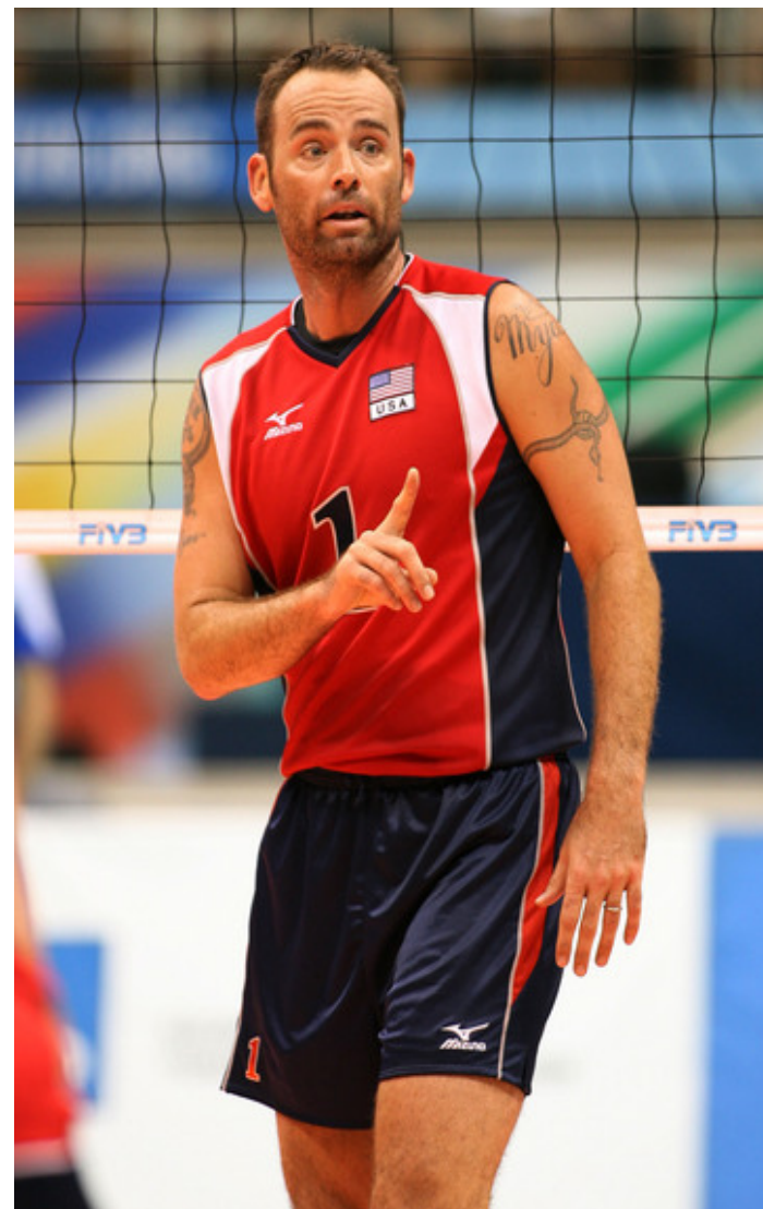
Ferdinando De Giorgi