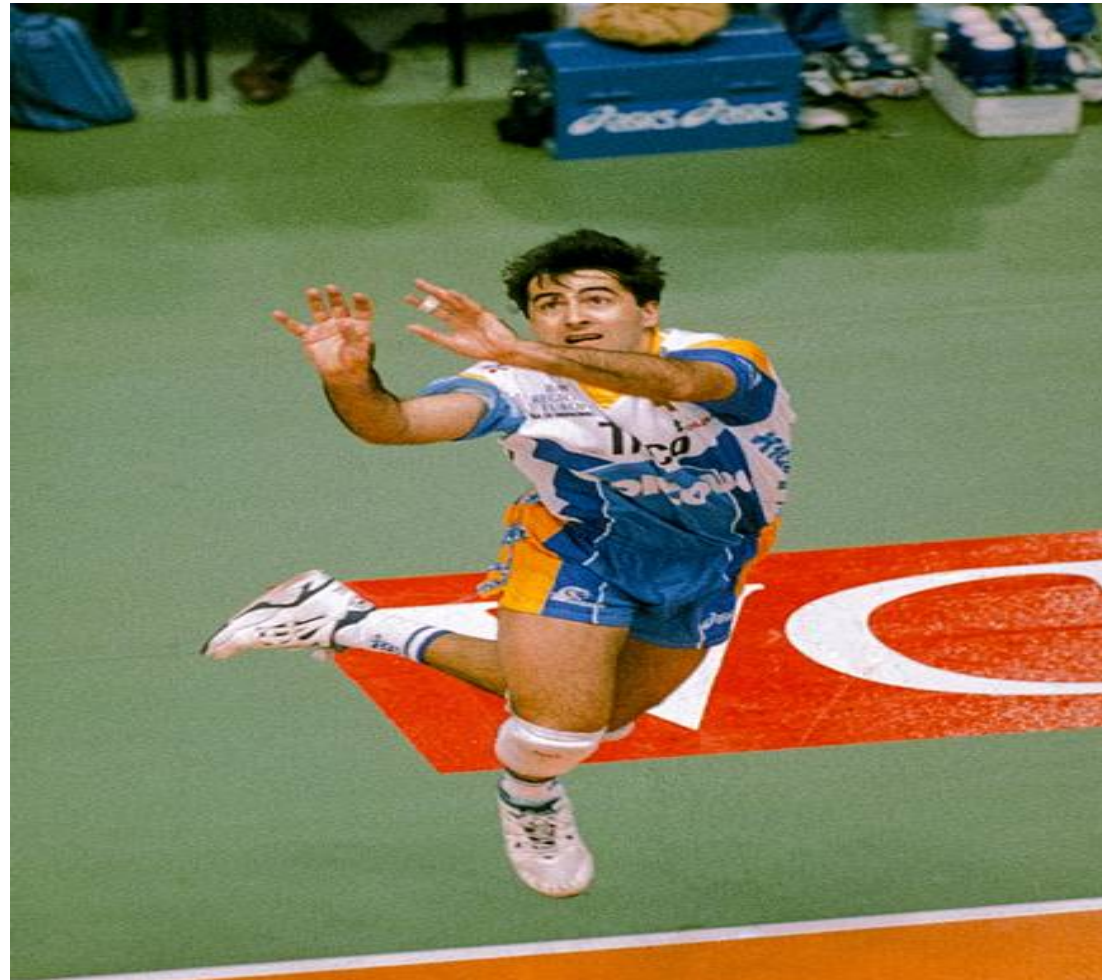
Ferdinando De Giorgi