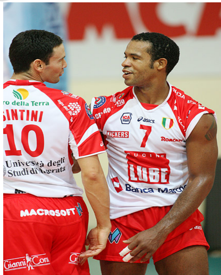
Ferdinando De Giorgi