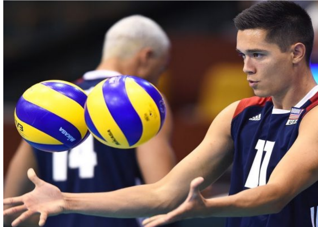
Ferdinando De Giorgi