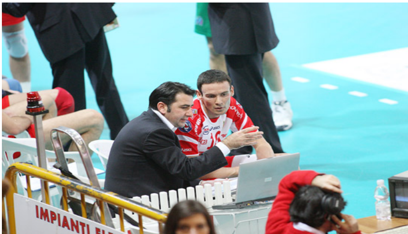
Ferdinando De Giorgi