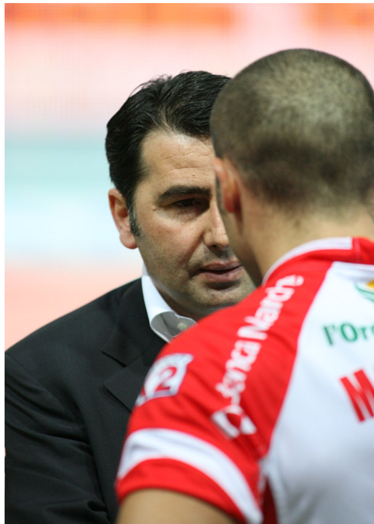
Ferdinando De Giorgi